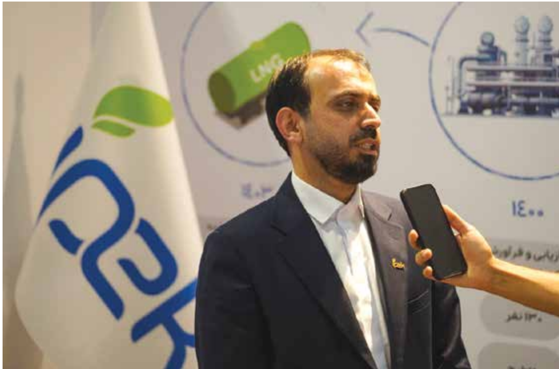
The license to construct a liquefied gas production plant on Kish Island, utilizing the expertise of domestic knowledge-based companies, was issued following the signing of a memorandum of understanding between the Kish Free Zone

Organization, Iran's Science and Technology Vice Presidency, and Aria Arvand Equipment Manufacturing Company.