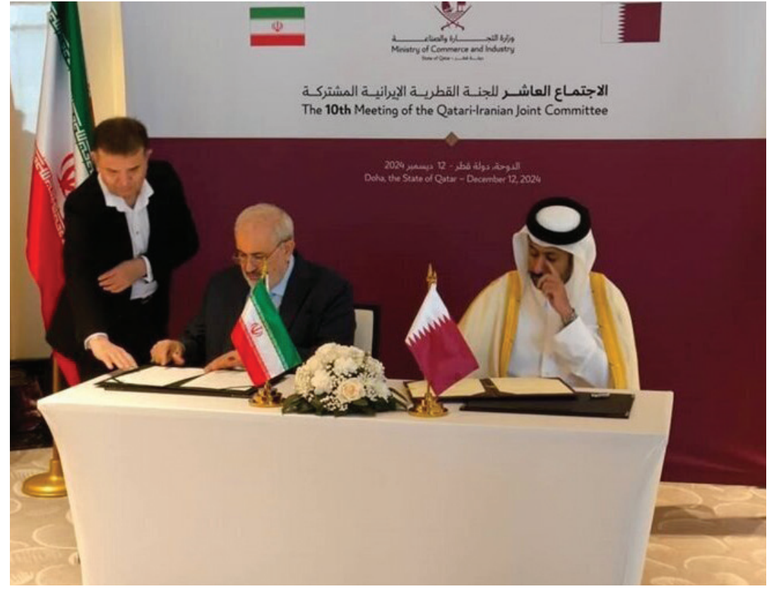
session underlined both nations' commitment to translating agreements into tangible outcomes and fostering regional cooperation. At the end of the meeting, the two sides signed a comprehensive cooperation document to determine the framework of cooperation in the coming year.

The Iran-Qatar Joint Economic Committee, established in 1995, has facilitated significant achievements, particularly in water and electricity sectors. The 10th